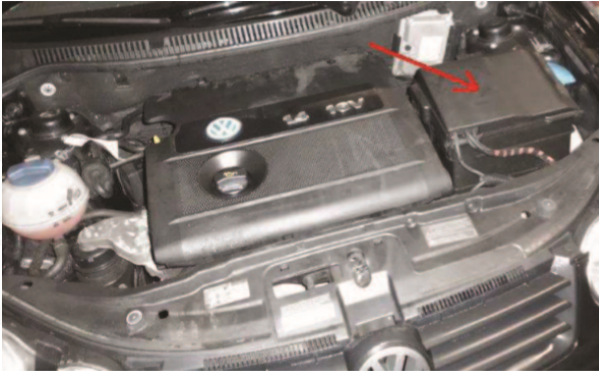
(a) Sicherungshalter auf der Batterie

Hilfe finden Sie auch in der VCDS.de-Chatgruppe http://dechat.vcds.de .